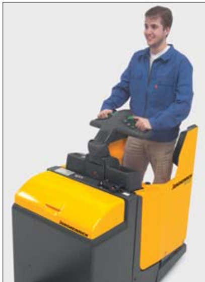
Posición óptima del operario debido a la barra timón corta