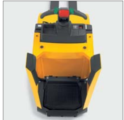
Puesto de conductor con protecciones laterales cerradas