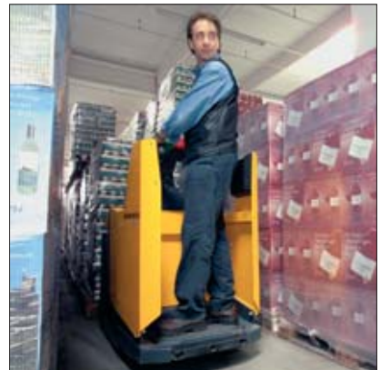
Especialmente adecuada para trasladarse en pasillos estrechos